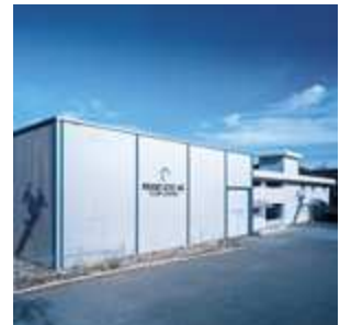
Franz Gysi AG Suhr

Bei all unseren Aktivitäten haben wir ein klares, übergeordnetes Ziel: Wir wollen zufriedene Kunden, die langfristig mit uns zusammenarbeiten. „