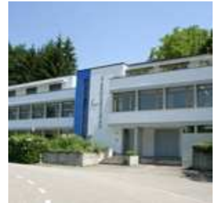
Gysi Dichtungstechnik AG Rheinsulz